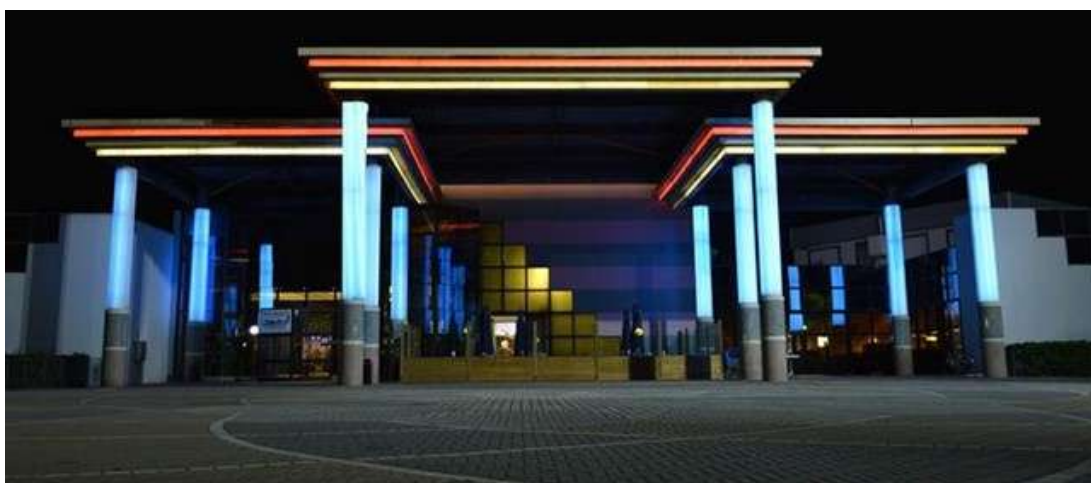
L'ingresso dello Sport Park di Fano