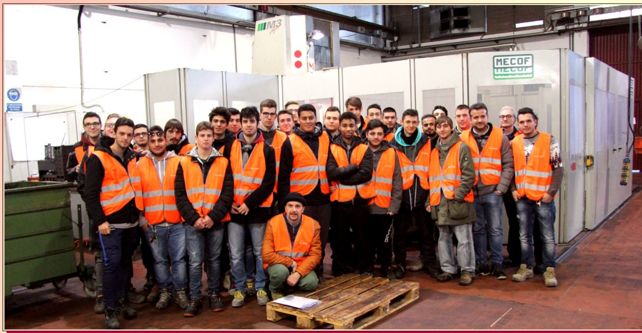
Visita Aziendale TMB-Grimeca Ceregno (RO)

Attraverso il PCTO gli studenti possono entrare in contatto con il mondo aziendale.