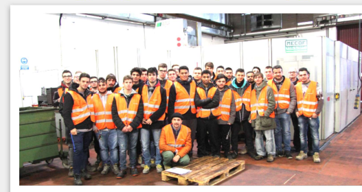
Visita Aziendale TMB-GRIMECA Ceregnano (RO)

L'istituto IPSIA "Enzo Bari" è una delle scuola che nel territorio vanta tra i più alti tassi di occupazione post diploma del territorio alto-olesano , collaborando con AZIENDE come: FRIGOVENETA, RETICE, RPM, AERMEC, IRE impianti, ed altre circa 120 aziende nelle provincie di Rovigo, Padova e Verona; oltre agli Enti Locali ed alle Associazioni di Categoria!