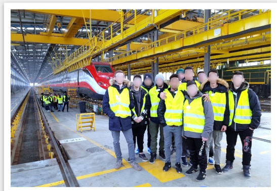
Visita IMC-Mestre (VR) impianto di manutenzione Treni FS Regionali Freccia Rossa

NON SCORDARTI DI PRENOTARE IL TUO MINI STAGE!