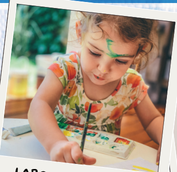
LABORATORI LUDICO DIDATTICI

che ha coinvolto tutti i comuni dell'area attraverso la somministrazione di questionari rivolti a sindaci e referenti istituzionali in materia di turismo e sviluppo territoriale.