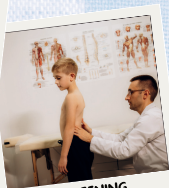
SCREENING SANA POSTURA