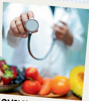
CONSIGLI PER UNA SANA ALIMENTAZIONE