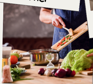
SHOW COOKING: LA PREPARAZIONE, LE RICETTE E I SEGRETI DELLA DIETA MEDITERRANEA