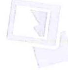
IMMAGINE NON DISPONIBILE