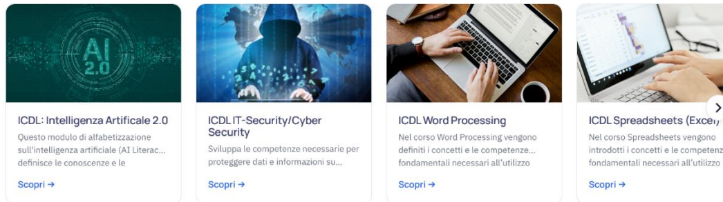
Figura 1 - Catalogo presente nella pagina AICA-LAB al link: https://aicalab.aicaformazione.it/

I percorsi di preparazione agli esami delle principali certificazioni informatiche.