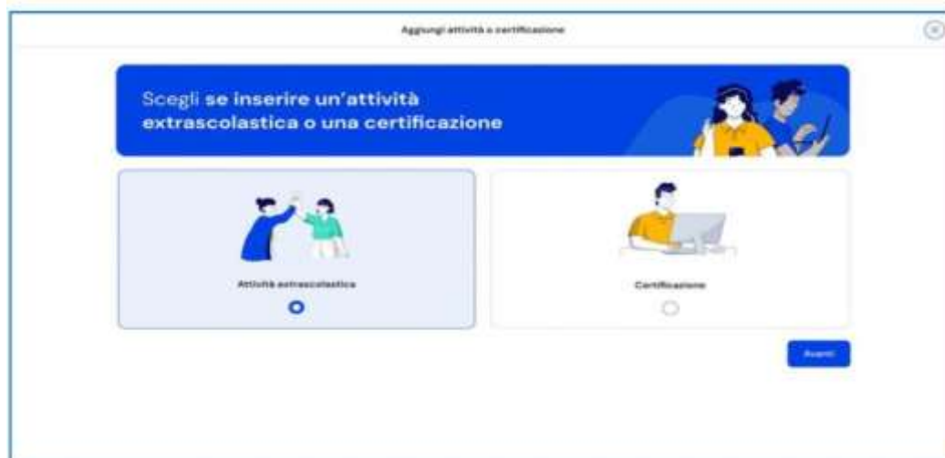
FIGURA 15 – SCHERMATA AGGIUNGI ATTIVITÀ EXTRASCOLASTICA

Gli Studenti dovranno completare la compilazione entro la fine del mese di maggio 2024 . I Docenti Tutor per l'orientamento forniranno assistenza per la corretta compilazione.