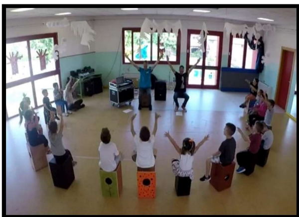
Laboratorio Propedeutica Musicale 3-6 anni Scuola dell'Infanzia "Arcobaleno", Eraclea Paese