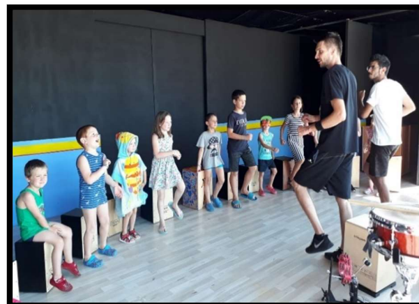
Laboratorio musicale MULTILINGUA (inglese/tedesco) "Camping Portofelice", Eraclea Mare