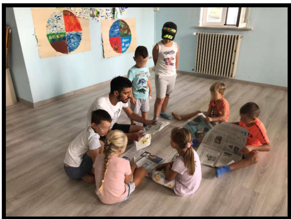
Laboratorio musicale 3-6 anni e 6-11 anni "Associazione Culturale Passarella Insieme"