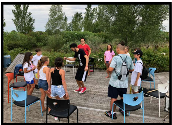
Drum Circle "Centro Il Nocciolo" Jesolo Paese