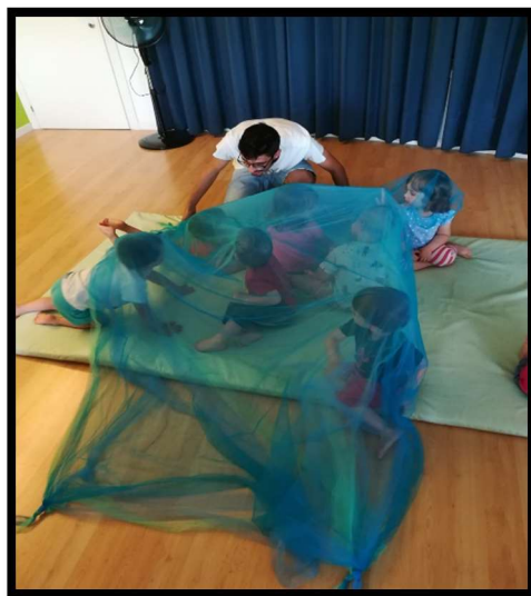
Musicoterapia 0-3 anni Micro Nido "I monelli" Jesolo Paese