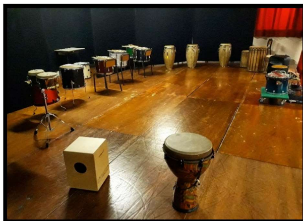
Laboratorio di percussioni e ritmo tribale Scuola Elementare "Enrico Toti", Musile di Piave