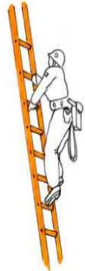
Fig. 41 - Corretta procedura di salita e discesa