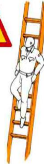
Fig. 40 - Erronea procedura di salita e discesa