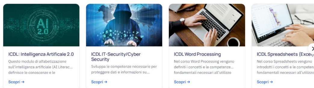
Figura 1 - Catalogo presente nella pagina AICA-LAB al link: https://aicalab.aicaformazione.it/

I percorsi di preparazione agli esami delle principali certificazioni informatiche.