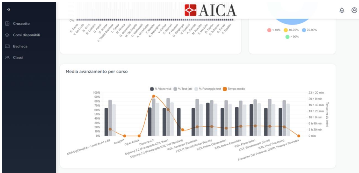
Figura 3 - sezione "Statistiche classe" raggiungibile da "Classi" su AICA-LAB.