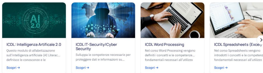
Figura 1 - Catalogo presente nella pagina AICA-LAB al link: https://aicalab.aicaformazione.it/

I percorsi di preparazione agli esami delle principali certificazioni informatiche.