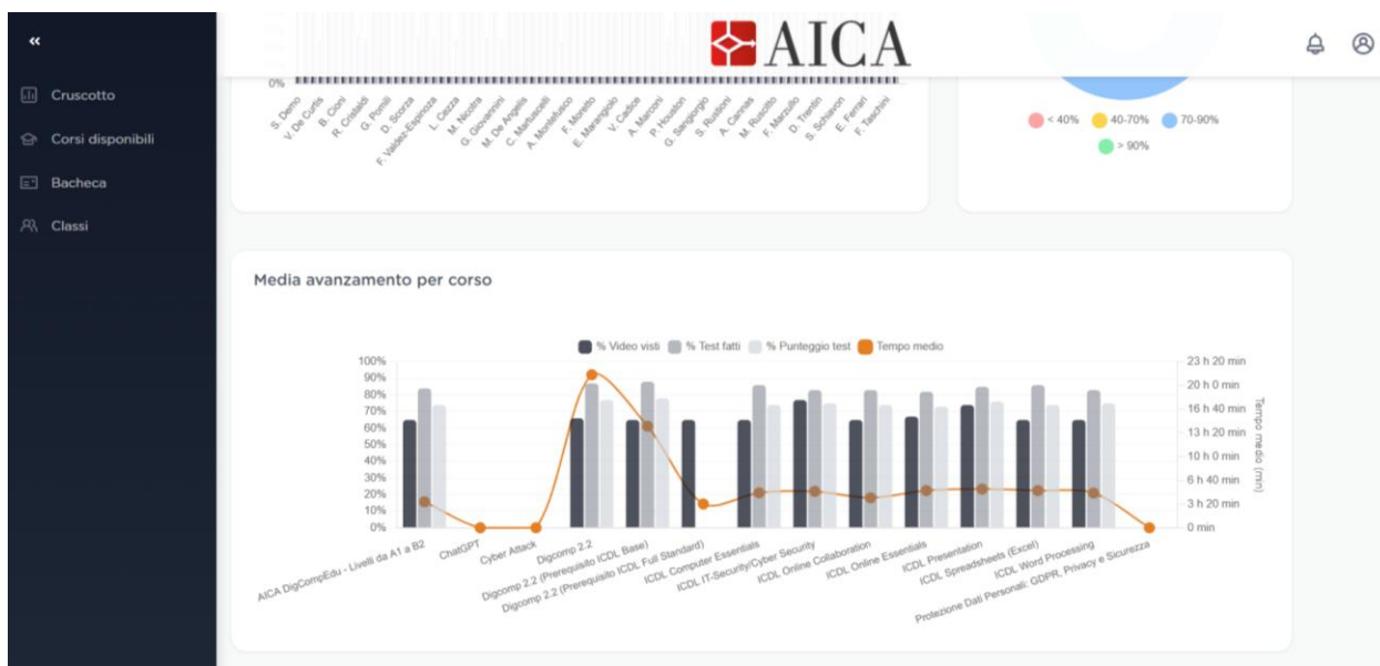
Figura 3 - sezione "Statistiche classe" raggiungibile da "Classi" su AICA-LAB.