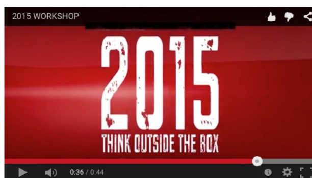
Teachers Workshop 2015

info@bellbeyond.it o telefonateci: 0184 1898180