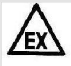
Locale con possibile presenza di atmosfera esplosiva

Segnalare con cartelli conformi a quanto stabilito dall'articolo 293 (comma tre) del D.Lgs. 81/2008 la presenza di zone con pericolo di esplosione (cartello a forma triangolare; lettere in nero su fondo giallo, bordo nero; lettere da riportare: "EX"):