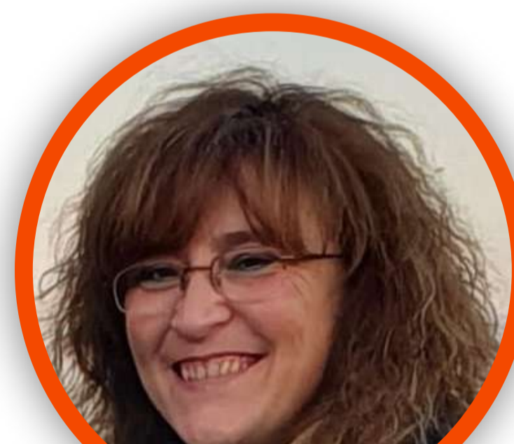
MARIANGELA MAPELLI SCUOLA PRIMARIA